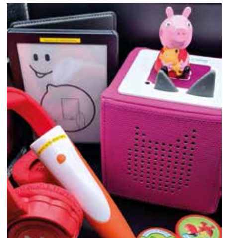
In der Stadtbibliothek Brandis kann man sich in der LeihBar technische Endgeräte ausleihen.