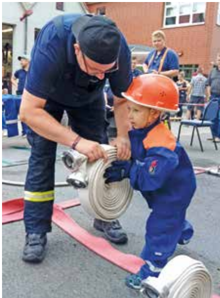
Auch die Kleinsten hatten ihren Spaß.

Am 1. Juli gaben wir einen Einblick in unseren Feuerwehralltag. Im und an unserem Feuerwehrgerätehaus gab es viel zu entdecken. Bei Führungen stellte der Wehrleiter den vielen Interessenten unsere Räumlich-