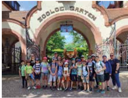
Die 3b verbrachte einen Tag im Leipziger Zoo.