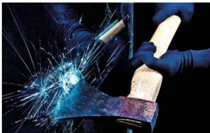
Geprüftes Sicherheitsglas hält selbst roher Gewalt stand, ohne in unzählige Splitter zu zerbrechen.