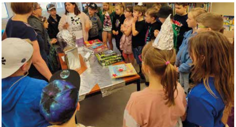
Die 3b traf in der Bibliothek auf Aliens.