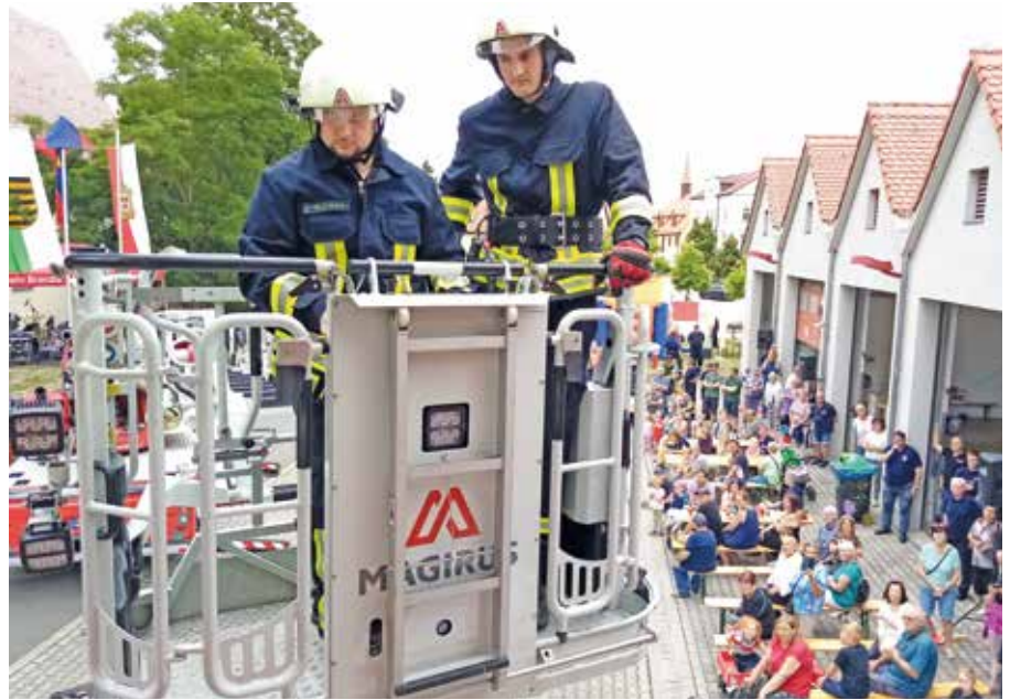
Mit der Drehleiter wurde die Rettung einer Person aus dem 1. Obergeschoss demonstriert.

keiten und unsere ehrenamtliche Arbeit vor. Die Einsatzkräfte führten die Technik vor und zeigten eine realitätsnahe Rettung einer Person aus einem Fenster im ersten Obergeschoss. Dabei wurde der Umgang mit dem Sprungpolster und der Drehleiter demonstriert. Unsere kleinen und großen Gäste konnten am eigenen Leib erfahren, was es bedeutet, eine Einsatzkraft zu sein. Zuerst galt es in einem Wettbewerb die Einsatzbekleidung so schnell wie möglich anzuziehen und anschließend verschiedenste Feuerwehrtätigkeiten zu absolvieren.