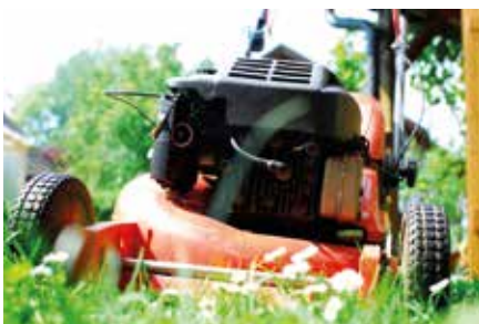
Die Ruhezeiten, in der kein Rasen gemäht werden darf, sind in der Polizeiverordnung der Stadt Brandis festgelegt.

An Straßeneinmündungen und -kreuzungen müssen Hecken, Sträucher und andere Anpflanzungen stets so niedrig gehalten werden, dass eine ausreichende Übersicht für die Kraftfahrer gewährleistet ist. Diese Anpflanzungen dürfen im Allgemeinen nicht höher als 80 cm sein. 🌸