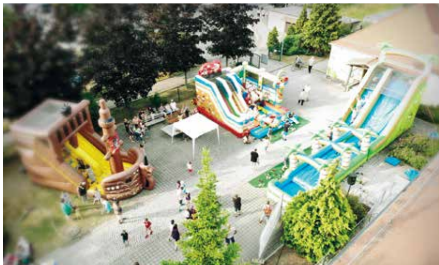
Drei Hüpfburgen standen für Spiel und Spaß zur Verfügung.