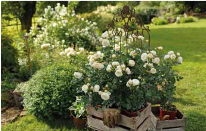
Rosen lieben die Sonne und belohnen Gartenfreunde mit üppiger Blüte.