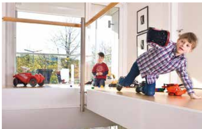
Sicherheitsglas bewährt sich mit seinen Eigenschaften auch im Inneren, beispielsweise rund um Balustraden und Treppengeländer.

Hauseigentümer sind gut beraten, sich des Risikos bewusst zu sein – und es den Einbrechern nicht zu leicht zu machen. Bei einer veralteten Technik etwa an Türen und Fenstern gelingt es erfahrenen Verbrechern oft, sich binnen Sekunden Zugang zu verschaffen. Sicherheitstechnik zielt darauf ab, das Eindringen zumindest zu erschweren. Denn je länger ein Ganove braucht, desto eher läuft er auch Gefahr, auf frischer Tat erappt zu werden. Deshalb suchen viele Täter das Weite, wenn der Zugang nicht in wenigen Augenblicken gelingt. Zu einem Plus an Sicherheit kann neben speziellen Verriegelungen auch Sicherheitsglas beitragen. Es ist in seinen Eigenschaften beispielsweise mit der Windschutzscheibe eines Autos vergleichbar: