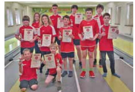
Sieger der Vereinsmeisterschaften Jugend.