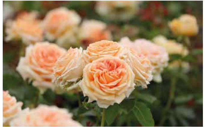
Rosen mit festen und ledrigen Blütenblättern sind besonders gut hitzegeeignet.

Auch wenn fast alle Rosen Sonnenanbeter sind, so gibt es dennoch Sorten, die besonders hitzestabil sind. Den Unterschied machen die Blütenblätter, erklärt Susanne Rattay: Je fester und ledriger sie sind, desto geringer fällt der Wasserverlust durch Verdunstung aus. Sorten wie etwa die Strauchrose Artemis mit milchweißen Blumen oder die zart apricotfarbene Matthias Claudius sind nicht nur für sommerliche Hitze, sondern auch für Starkregen gut gewappnet. Für viele Kletterrosen muss man ebenfalls keinen Sonnenschirm aufspannen, wenn die Temperaturen nach oben klettern. Stellvertretend für die