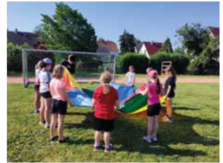
Sportlich ging es auf der Jahnhöhe zu.

Am 13. Juni 2023 hieß es endlich wieder „Sport frei“ in der Grundschule Brandis. Auf der Jahnhöhe fand unser Sportfest statt. In